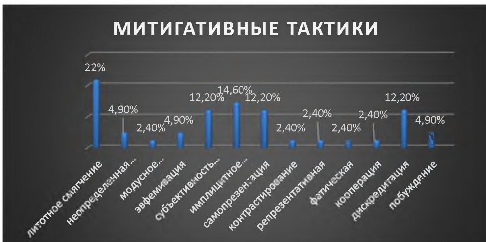
Рис.2. Митигативные тактики, использованные для реализации стратегий, указанных на рис. 1.

Наиболее частотной, как видно из показателей диаграммы, является стратегия самопрезентации; стратегия директивности, под которой понимается призыв/побуждение адресата к каким-либо действиям, тоже достаточно употребляемая в речи дипломатов; стратегия дискредитации, которая встречается вдвое реже стратегии самопрезентации, может свидетельствовать о том, что для дипломатической речи характерно позиционирование своих достоинств, чем недостатков оппонента. Остальные стратегии используются в дипломатических текстах в равной степени.