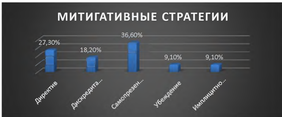
Рис.1. Митигативные стратегии, выявленные в процессе анализа дипломатической речи.

Наиболее частотной, как видно из показателей диаграммы, является стратегия самопрезентации; стратегия директивности, под которой понимается призыв/побуждение адресата к каким-либо действиям, тоже достаточно употребляемая в речи дипломатов; стратегия дискредитации, которая встречается вдвое реже стратегии самопрезентации, может свидетельствовать о том, что для дипломатической речи характерно позиционирование своих достоинств, чем недостатков оппонента. Остальные стратегии используются в дипломатических текстах в равной степени.