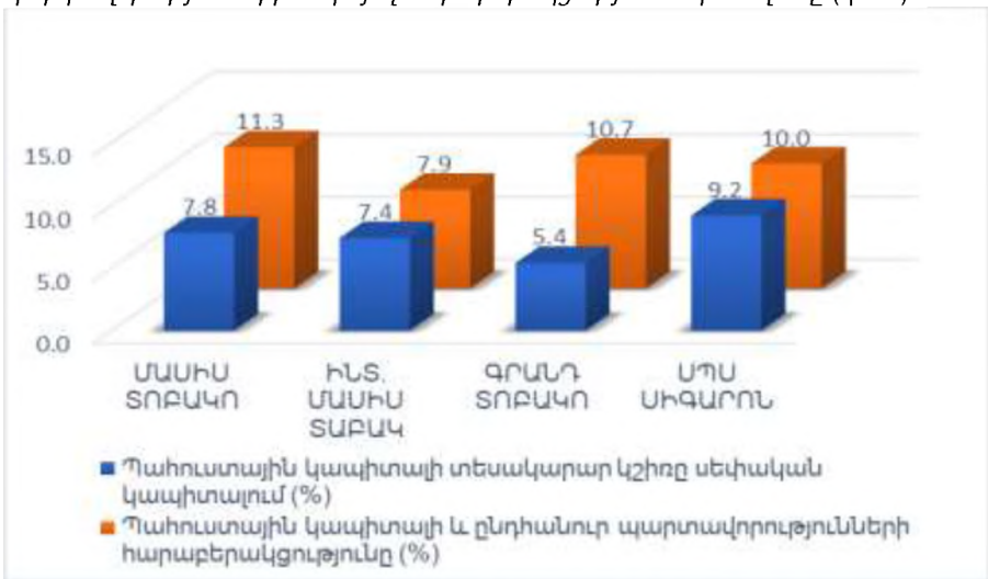
Գծապատկեր 5. ՀՀ-ում սիգարետ և սիգար արտադրող կազմակերպությունների պահուստային կապիտալի մասնաբաժինը սեփական կապիտալում 2016-2019թթ.

ՀՀ-ում սիգարետ և սիգար արտադրող կազմակերպությունների ձեռնարկատիրական ռիսկերի հաղթահարման այլընտրանքային լուծում մեր կողմից առաջարկվում է պահուստային և սեփական կապիտալի ու ընդհանուր պարտավորությունների հետևյալ հարաբերակցության ապահովումը (գծ. 5):