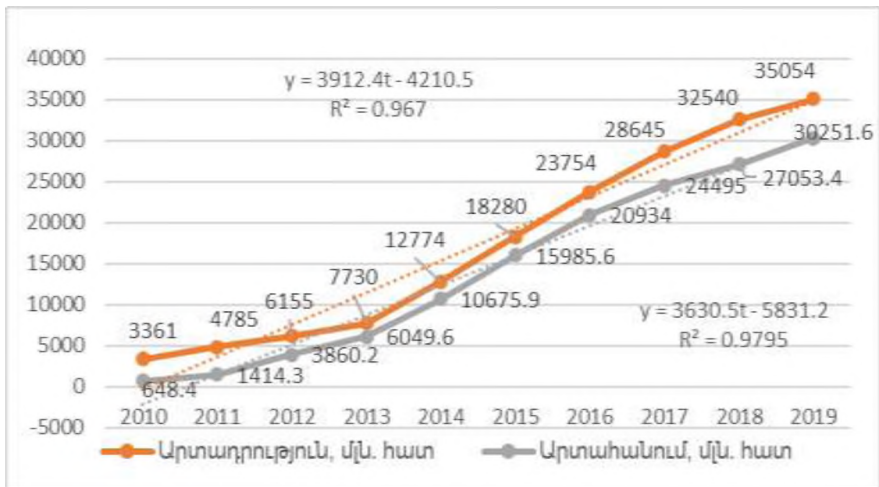
Գծապատկեր 1. ՀՀ-ում սիգարի և սիգարետի արտադրության ու արտահանման ծավալների դինամիկան 2010-2019թթ., մլն հատ 9