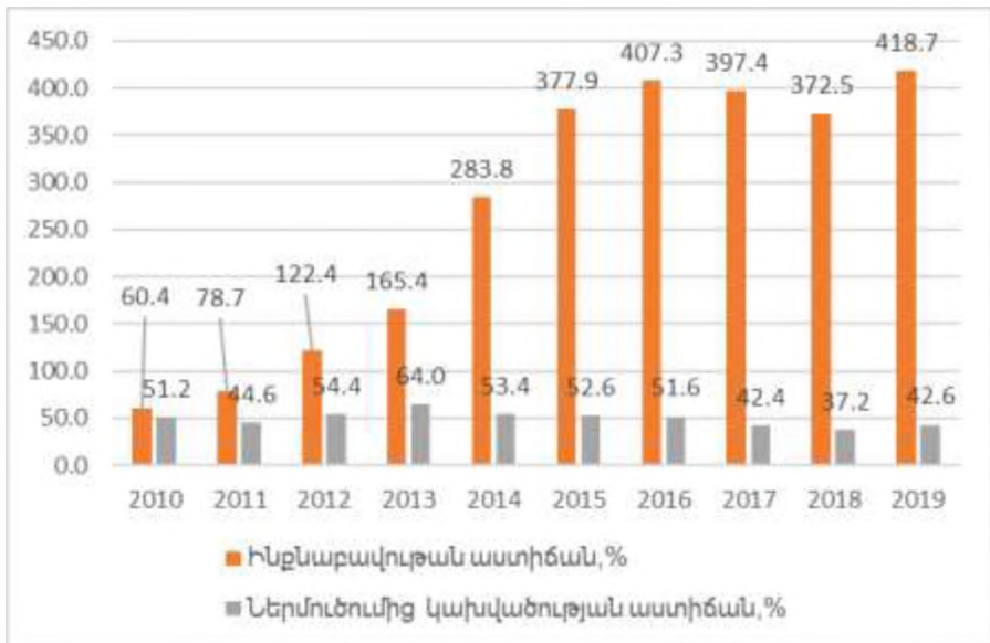
Գծապատկեր 4. ՀՀ-ում սիգարետների ինքնաբավության և ներմուծումից կախվածության աստիճանները 2010-2019թթ., %

Գծապատկեր 4-ի վերլուծությունից պարզ է դառնում, որ ՀՀ-ում սիգարետների ինքնաբավության աստիճանը 2010-2016թթ. աճել է չափազանց մեծ տեմպերով՝ 60.4 %-ից հասնելով մինչև 407.3%: 2017-2018թթ. գրանցվել է այս ցուցանիշի նվազում: 2018թ. 2016թ. նկատմամբ այն նվազել է 34.8 տոկոսային կետով, իսկ 2017թ. նկատմամբ՝ 24.9 տոկոսային կետով՝ դառնալով 372.5%, որը հիմնականում պայմանավորված է եղել ՀՀ հարկային և մաքսային քաղաքականությամբ: