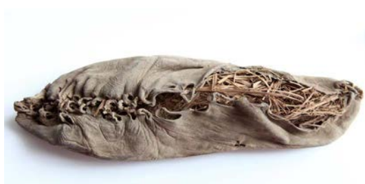
Рис. 4. Гранатовые сувениры; ботинок из пещеры Арени.

Вместе с гранатом свое первенство в символике Армении отстаивает виноградная лоза. Армянскую живопись, армянскую архитектуру, литературу невозможно представить без этого символа. Виноград живет и в легендах. Согласно библейскому преданию, Ной, выйдя из Ковчега, посадил виноградную лозу, из плодов которой потом получил вино. Виноградная лоза – один из ярких символов Библии. Глава 15 Евангелия от Иоанна начинается со слов: “Я есмь истинная виноградная лоза, а Отец мой – Виноградарь”. Армянская апостольская церковь в один из пяти великих праздников – Успения пресвятой Богородицы – освящает в церкви виноград.