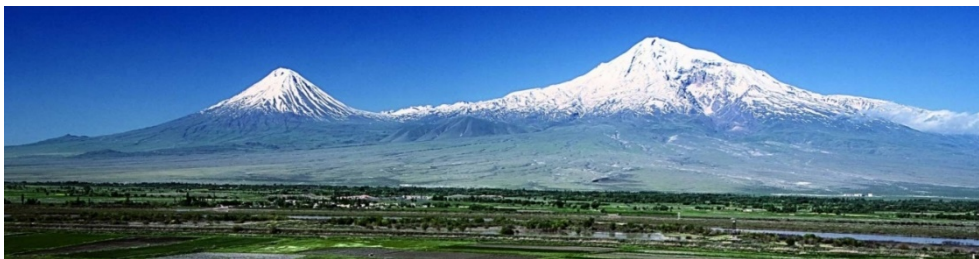
Рис. 1. Арарат.

Самым ярким и безусловным символом “страны-мечты” Армении является библейская гора Арарат. Она есть везде: на гербе Армении, в названиях гостиниц, ресторанов, спортивных клубов, в именах, в национальных брендах. Ее необыкновенная, величественная красота поражает. Арарат – это суть Армении и армян. Он всегда был неиссякаемым источником вдохновения для творцов, для художников и поэтов. Арарат заключает в себе некий сакральный смысл, дает возможность сохранить традиции, культуру, преемственность поколений (рис. 1).