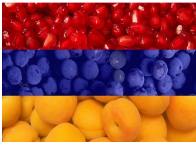
Рис. 3. Флаг РА.

Цвет абрикоса также по-своему уникален. Он отличается от своих собратьев из других стран и регионов. И название у этого цвета особенное – “цирани”, он всегда был королевским цветом. В праздничные дни короли надевали наряды цвета цирани. Цвет абрикоса присутствует в трехцветном армянском национальном флаге (рис. 3).