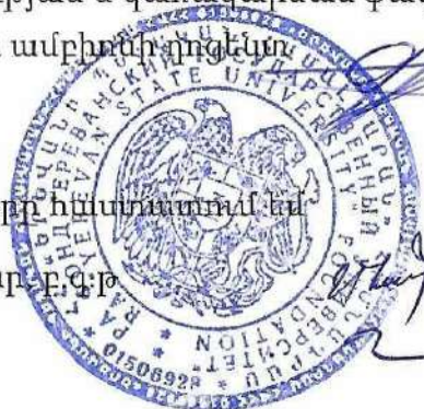
Գ. Ա. Սիրոյան

ԵՊՀ տնտեսագիտության և կառավարման ֆակուլտետի ֆինանսահաշվային ամբիոնի ղեկավար, տ.գ.թ.՝