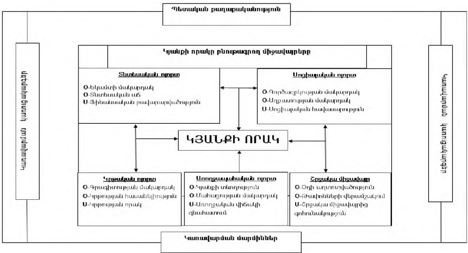
Գծապատկեր 1. Կյանքի որակի բնութագրման ամբողջական մոդել 2

Կյանքի որակը անհատի և հասարակության բարեկեցությունը բնութագրող բազմաչափ ինտեգրալ ցուցանիշ է, որն արտացոլում է առանցքային համարվող ոլորտների (սոցիալական, տնտեսական, կրթական, և այլ) օբյեկտիվ պայմանների և դրանցից անհատի սուբյեկտիվ բավարարվածության համադրությունը: Իսկ կյանքի որակի կառավարումը համակարգային, նպատակաուղղված և շարունակական գործընթաց է, որի միջոցով համայնքները, ինստիտուտները և պետությունը, պլանավորում, կազմակերպում, վերահսկում և բարելավում են հասարակության կյանքի որակի առանցքային համարվող ոլորտները՝ ապահովելով օբյեկտիվ պայմանների զարգացում և բնակչության սուբյեկտիվ բավարարվածության բարձրացում: